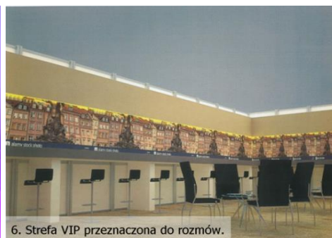
6. Strefa VIP przeznaczona do rozmów.

Dzięki takiej formule każda firma uczestnicząca w tym wyjątkowym wydarzeniu ma zapewniony odpowiedni prestiż tak bardzo istotny w kulturze Perskiej. Dodatkowo zaplanowaliśmy uroczystą kolację finalną dla zaproszonych gości w najbardziej prestiżowych miejscach w Teheranie w obrotowej restauracji w wieży Milad Tower lub restauracji Hotelu Espinas Palace, na którą każda firma polska będzie mogła zaprosić swoich partnerów Perskich.