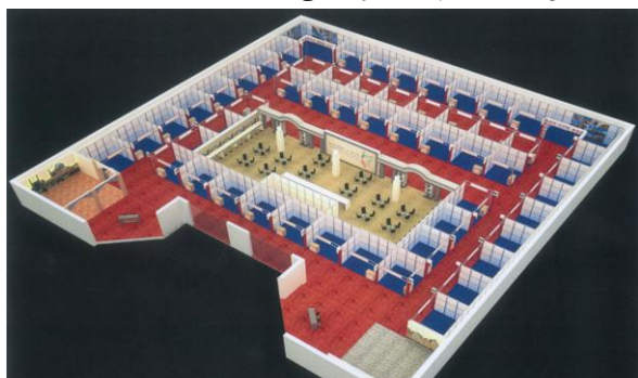
1. Widok ogólny hali od strony wejścia.

Hala II w Centrum Targowym Hijab Complex zagospodarowana jest według projektu perskiego.