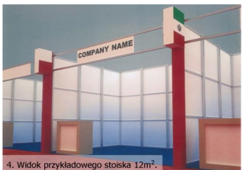
4. Widok przykładowego stoiska 12m 2 .

W centrum hali znajduje się specjalna Strefa VIP dostępna dla wszystkich uczestników, gdzie będzie można w specjalnej atmosferze prowadzić rozmowy z zaproszonymi przez nas gośćmi z całego Iranu. Strefa VIP ma zabezpieczenie cateringowe i pełny luksus perski.